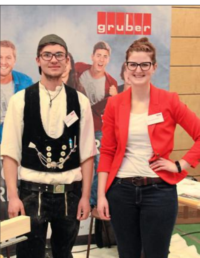
Tradition trifft Moderne.