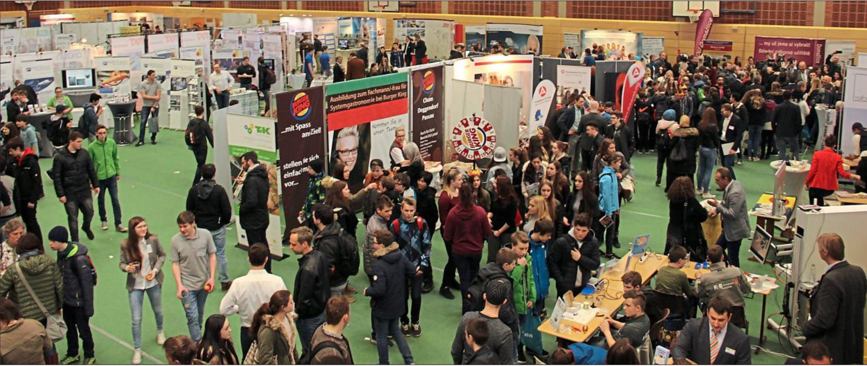
Die Schüler schoben sich in der Further Sporthalle von Stand zu Stand.