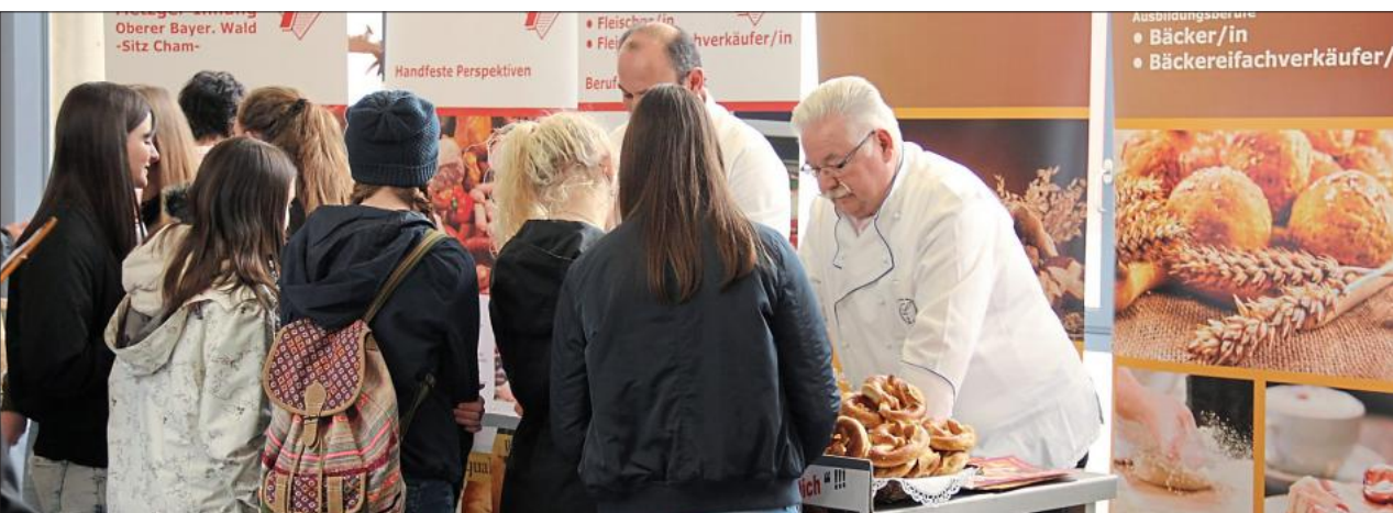
Wo es Essen gibt, ist immer viel los: Bäcker und Metzger brachten natürlich etwas zum Probieren mit.