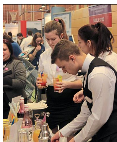
Alkoholfreie Cocktails gab's bei der tschechischen Delegation.