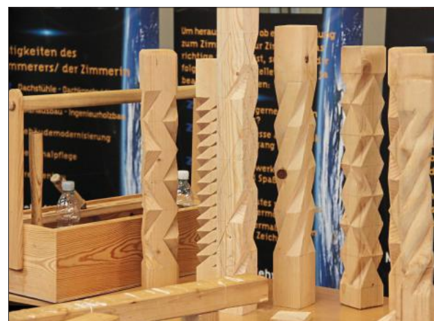
... und Handwerkskunst zu bestaunen.