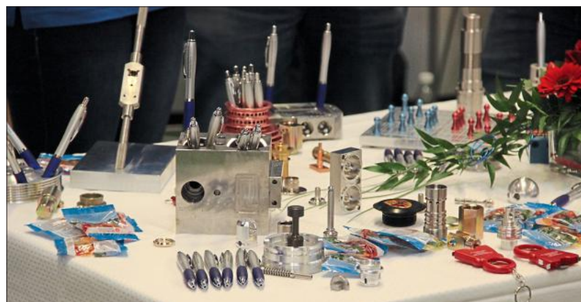
Zahlreiche Kleinteile aus Metall.