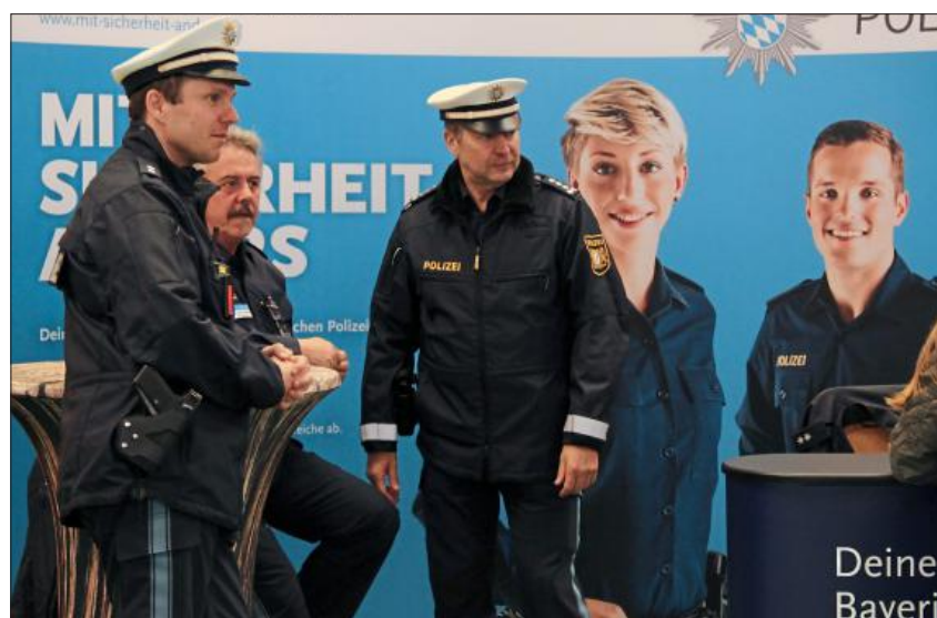
Auch die Polizei ist auf der Suche nach neuem Personal.