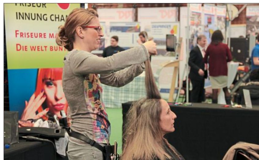
Die Friseure machten sich direkt an die Arbeit.