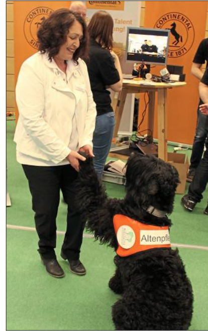
Auch Hunde können Ausbildung machen. Zum Beispiel Tara, Altenpflegehündin aus Chamerau.