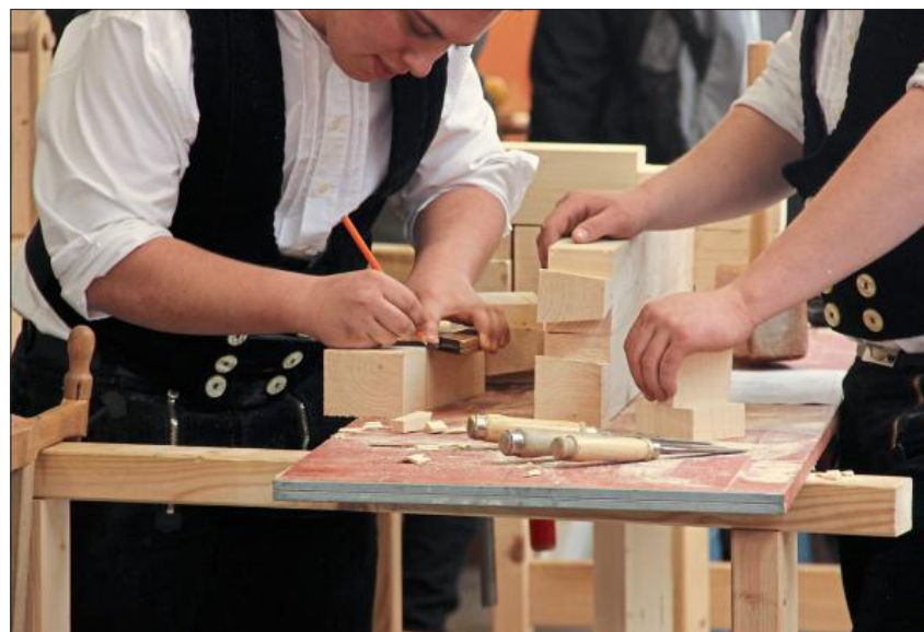
Die Zimmerer zeigten in der Aula der Mittelschule ihr Können.